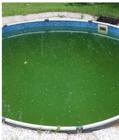
Znečištěná voda v bazénu před použitím FN ® AQUA.

Eko-přípravek pro čištění vody v bazénech a zahradních jezírkách a snížení spotřeby bazénové chemie