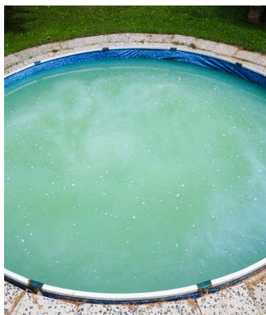
Stav vody v bazénu 3. den po aplikaci FN ® AQUA.