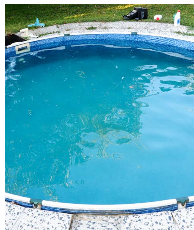
Voda se po 7 dnech působení FN ® AQUA plně vyčistila. Mikroorganismy obalené minerály klesly na dno jako kal.